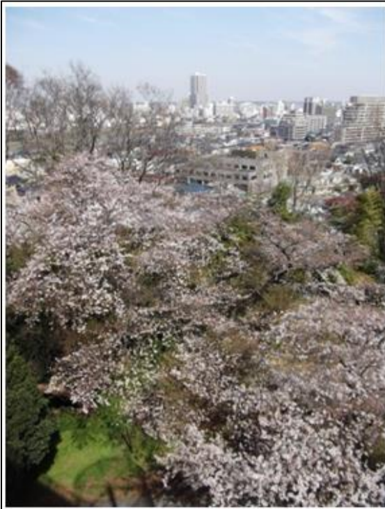
敷地内の桜が見頃を迎えています 病室でお花見をお楽しみ下さい