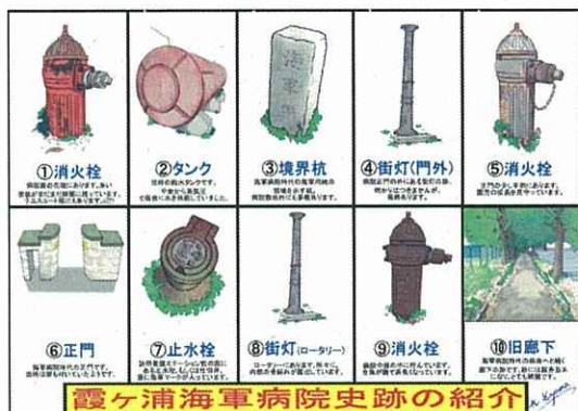
霞ヶ浦海軍病院史跡の紹介

以前より、整備を行っておりましたテニスコートの工事が3月末に完了しました。土浦市の管理により平成27年5月1日より利用が可能となります。