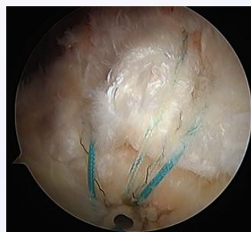
(スーチャーアンカーを使用した修復)

一方で、関節鏡手術は「小さな手術」という意味ではありません。術後の回復には、適切な麻酔管理と痛みのコントロール、そして段階的なリハビリテーションが非常に重要です。当センターでは、麻酔科医師と連携し、術後の痛みをできるだけ軽減しながら、安全に早期リハビリを進められる体制づくりを行っています。医師・麻酔科医師・作業療法士が協力し、それぞれの回復段階に合わせた治療を提供しています。