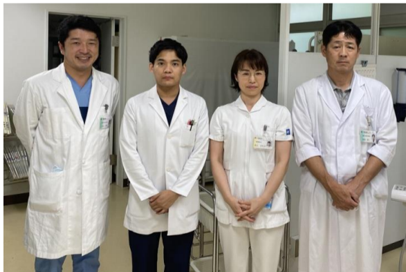
写真2 当院の口腔ケアチーム

口腔ケアは、患者様の生活の質を向上させるために重要な役割を果たします。当院では、最新の口腔ケアグッズを使用し、患者様の快適な治療を実現しています。