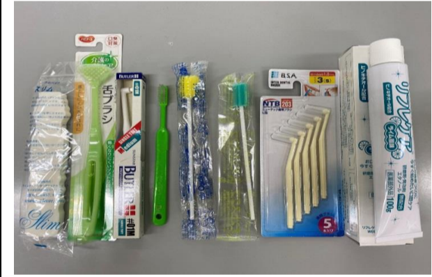
写真1 実際に当院で使用している様々な口腔ケアグッズ

口腔ケアは、患者様の生活の質を向上させるために重要な役割を果たします。当院では、最新の口腔ケアグッズを使用し、患者様の快適な治療を実現しています。